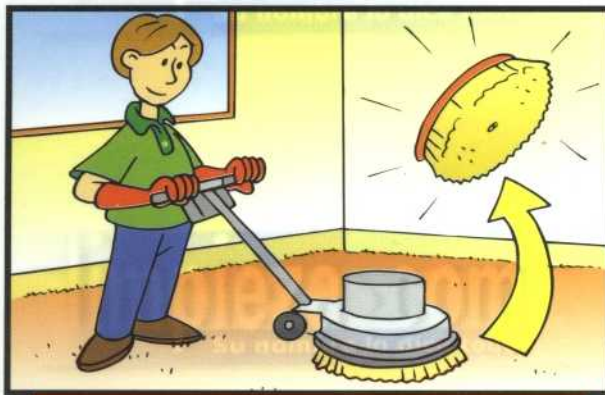
1 COLOQUE EL CEPILLO EN LA ROTATIVA