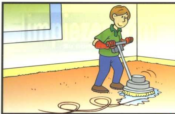
3 TRABAJE DESCRIBIENDO ESPIRALES