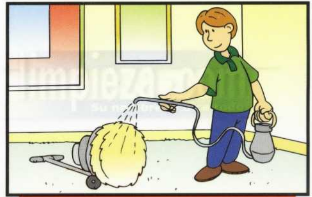
2 ROCIE TAMBIÉN EL BONETE