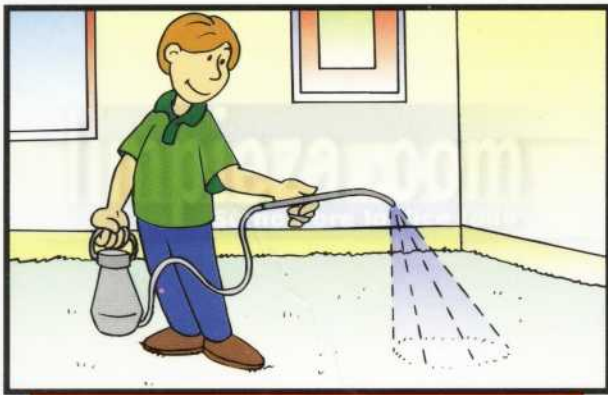
1 ROCIE LA MOQUETA CON PULVERIZADOR DE PRESIÓN Y PRODUCTO ESPECÍFICO