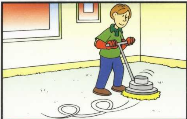
3 PÁSELO POR LA MOQUETA DESCRIBIENDO ESPIRALES