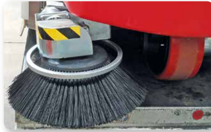
Spazzole laterali destra e sinistra Left and right side brushes Cepillos laterales, izquierda y derecha