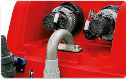
Doppio motore aspirazione Twin vacuum motors Doble motor de aspiración