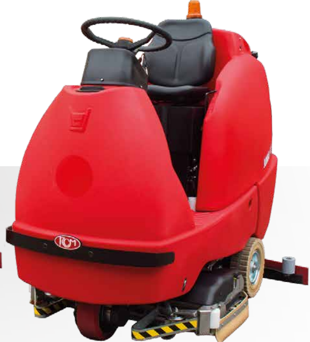
JUMBO lavante-spazzante scrubbing-sweeping fregadora-barredora