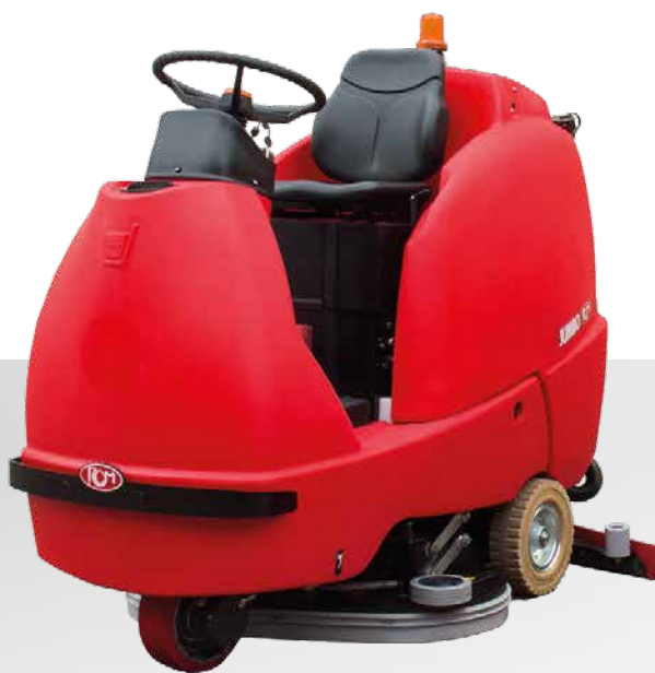
JUMBO lavante scrubbing fregadora