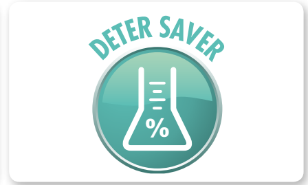
Sistema dosaggio detergente Detergent dosing system Sistema dosificación detergente