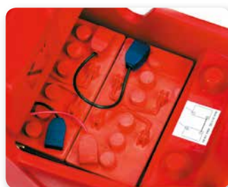
2 BATTERIE 12V-110 Ah (20h)* 2 12V-110 AH (20H) BATTERIES* 2 BATTERIES 12 V-110 Ah (20h)