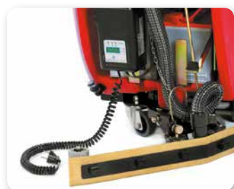
CARICA BATTERIA ON-BOARD ON-BOARD BATTERY CHARGING CARGADOR DE BATERÍA INCORPORADO