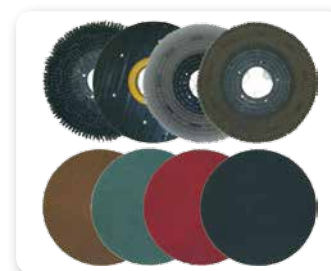
SPAZZOLE, DISCHI TRASCINATORI E ABRASIVI BRUSHES, DRIVE DISKS AND ABRASIVES CEPILLOS, DISCOS DE ARRASTRE Y ABRASIVOS