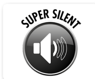
MOTORE ASPIRAZIONE SILENZIATO SILENCED VACUUM MOTOR MOTOR DE ASPIRACIÓN SILENCIADO (GO T STANDARD)