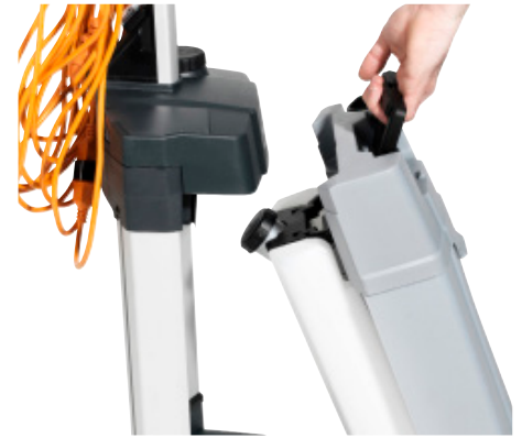
Los depósitos se pueden sacar rápidamente y pueden ser transportados a mano.

El manillar ergonómico se puede inclinar hacia abajo para una limpieza efectiva en posiciones bajas. Y el cable desmontable se almacena fácilmente en el enrollador.