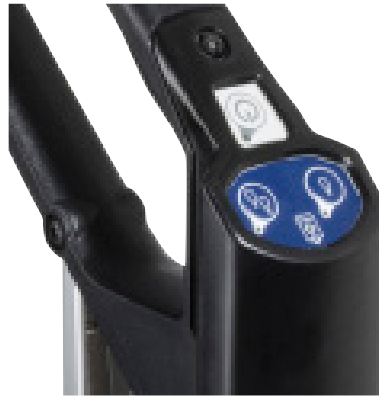
Conseguirá un control total de la fregadora gracias al panel con dos ajustes de caudal y con un indicador que te avise cuando el depósito no tiene detergente.