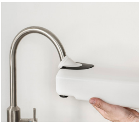
Rellene el depósito de agua bajo cualquier fregadero