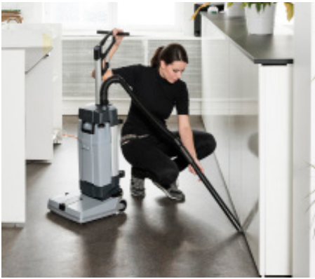
La manguera de succión opcional es ideal para limpiar zonas inalcanzables