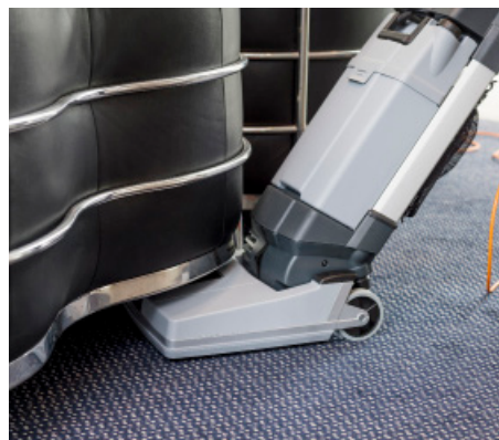
La SC100 limpia en profundidad huecos desde 25 cm de alto