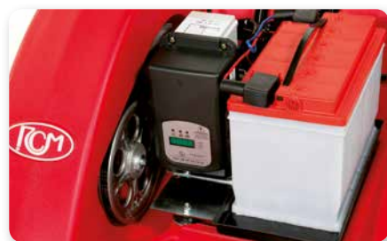
CARICA BATTERIA ON-BOARD ON-BOARD BATTERY CHARGING CARGADOR DE BATERÍA INCORPORADO