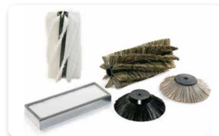
SPAZZOLE E FILTRI BRUSHES AND FILTERS CEPILLOS Y FILTROS