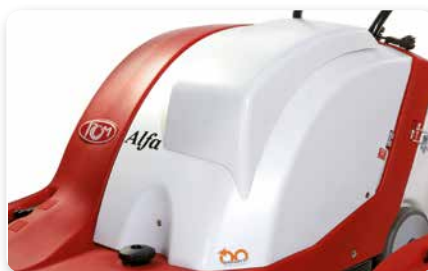
COFANO MAGGIORATO OVERSIZE BONNET CAPÓ MEJORADO